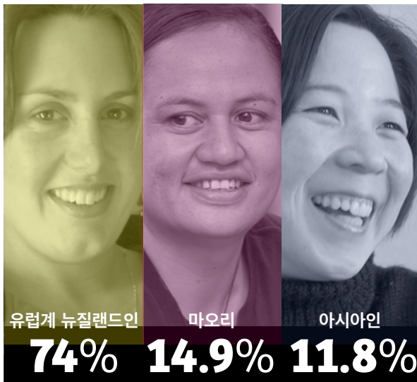
뉴질랜드 인구의 인종 구성, 2013년도 인구주택 총조사

위한 조직 목표를 정했습니다. 본 전략은 향후 5개년에 걸쳐 어떻게 이것을 달성할 것인지에 대해 설명합니다.